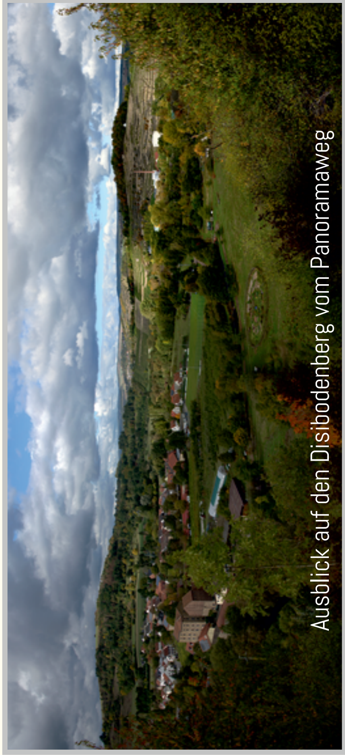
Ausblick auf den Disibodenberg vom Panoramaweg